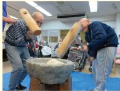
昔取った杵柄ですね