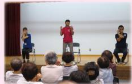
介護予防教室の様子