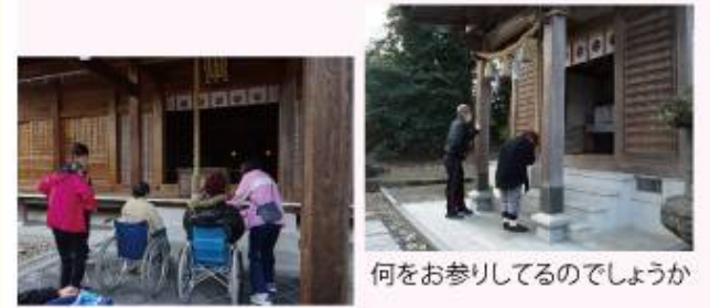
何をお参りしてるのでしょうか