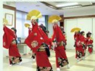
着物姿がかわいいです