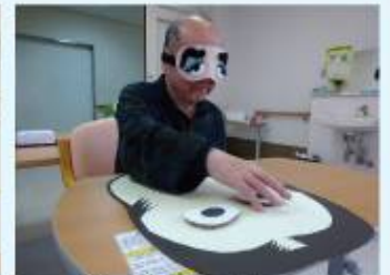
笑って過ごしましょう!