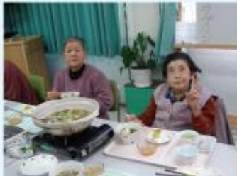
仲間と楽しく食事して…